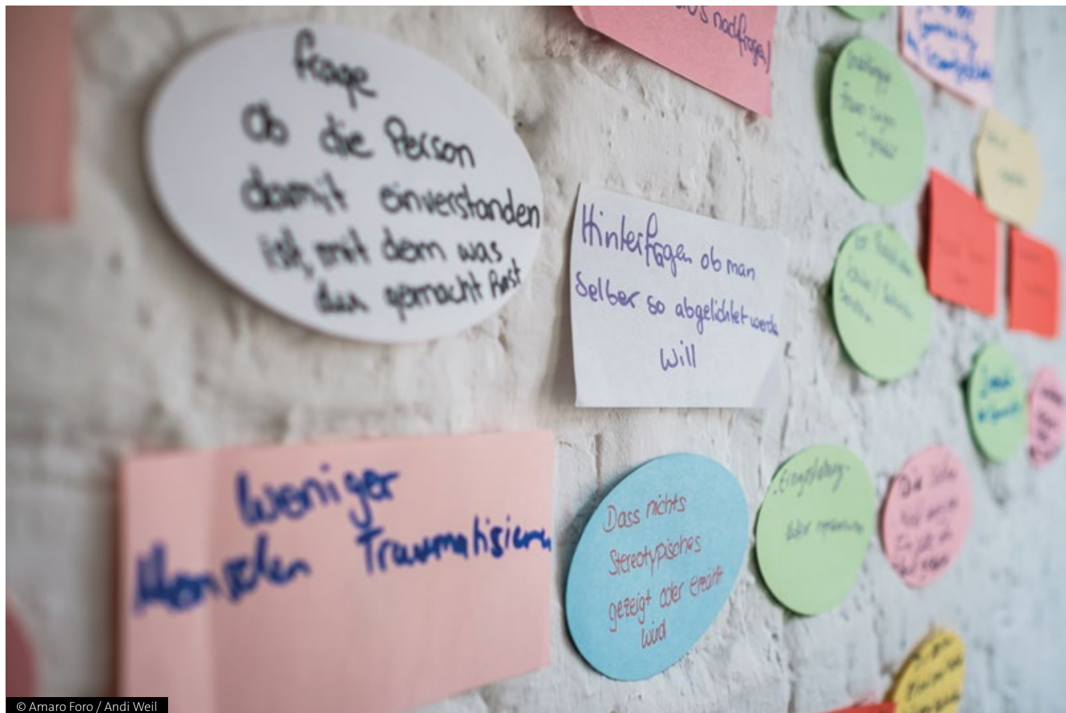
© Amaro Foro / Andi Weil